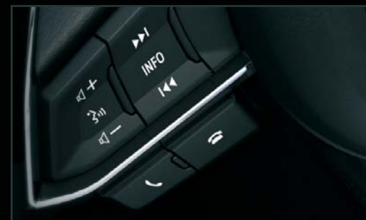
Управління на кермі

Голосове керування легко активується за допомогою кнопки на кермі, а розташовані поруч інші елементи керування дозволяють відповісти/відхилити телефонний дзвінок або передивлятися файли/списки відтворення під час прослуховування музики.