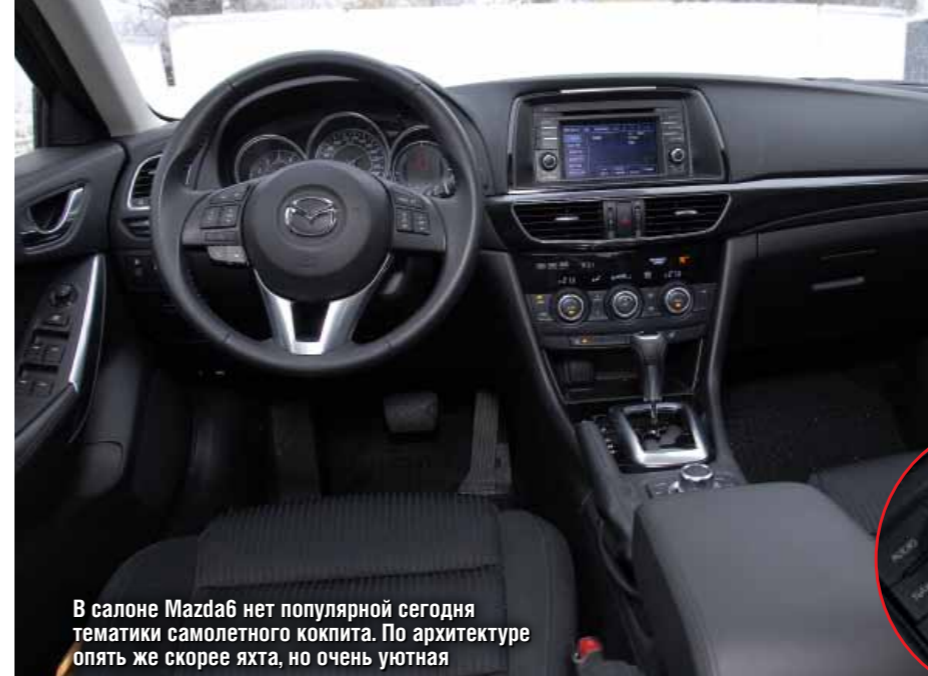
В салоне Mazda6 нет популярной сегодня тематики самолетного кокпита. По архитектуре опять же скорее яхта, но очень уютная

легкости этого транспортного средства не омрачит ничто. Mazda6 по ощущениям напоминает легкую стремительную яхту. И, кстати, ездит соответственно. Два призвания Она отлично управляет, четко держит курс, уверенно поглощает волны отечественного асфальта и ровно чертит дугу поворота. Но не стоит ожидать от