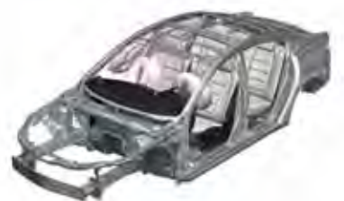
Уже в базовой комплектации Mazda6 оснащена шестью подушками безопасности