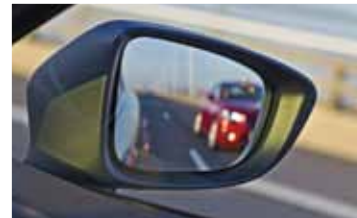
О появлении в мертвой зоне автомобиля сигнализирует специальный индикатор в зеркале заднего вида