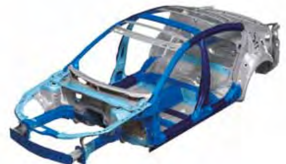
В конструкции авто широко использованы высокопрочные стали, что позволило снизить массу и увеличить жесткость кузова